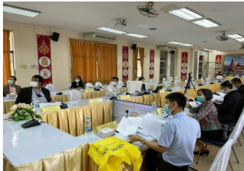
ภาพที่ ๖ แสดงการประชุมวิพากษ์ (ร่าง) คู่มือหลักสูตรด้านทฤษฎีศึกษาภาคเหนือ พ.ศ. ๒๕๖๕ สำหรับสถานศึกษาในสังกัด กศน.