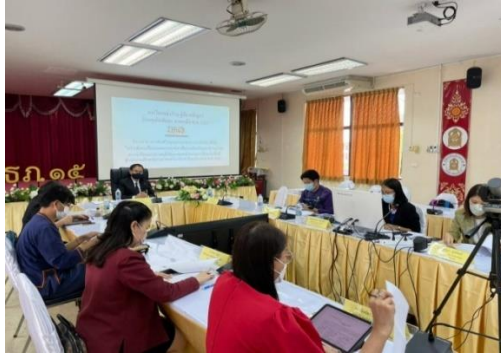
ภาพที่ ๕ แสดงการประชุมวิพากษ์ (ร่าง) คู่มือหลักสูตรด้านทฤษฎีศึกษาภาคเหนือ พ.ศ. ๒๕๖๕ สำหรับสถานศึกษาในสังกัด สช.

สังกัดสำนักงานคณะกรรมการส่งเสริมการศึกษาเอกชน และ (ร่าง) คู่มือหลักสูตรด้านทฤษฎีศึกษาภาคเหนือ พ.ศ. ๒๕๖๕ สำหรับสถานศึกษาสังกัดสำนักงานส่งเสริมการศึกษานอกระบบและการศึกษาตามอัธยาศัย ไปปรับปรุงเพื่อให้คู่มือมีความสมบูรณ์ก่อนนำไปใช้