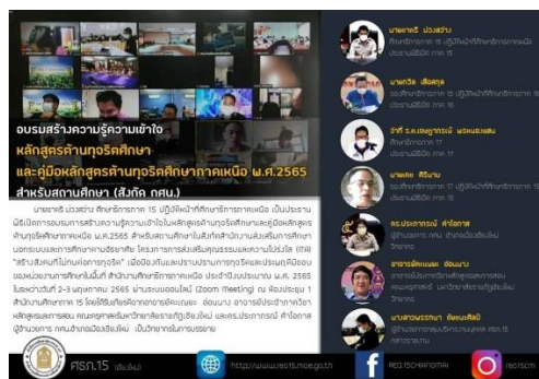
ภาพที่ ๙ แสดงการอบรมสร้างความรู้ความเข้าใจในหลักสูตรด้านทฤษฎีศึกษา และคู่มือหลักสูตรด้านทฤษฎีศึกษาภาคเหนือ พ.ศ. ๒๕๖๕ สำหรับสถานศึกษาในสังกัด กศน.

๑.๒ จัดส่งคู่มือหลักสูตรด้านทฤษฎีศึกษา พ.ศ. ๒๕๖๕ ให้แก่หน่วยงานการศึกษาใช้เป็น แนวทางการปฏิบัติงาน ดังนี้