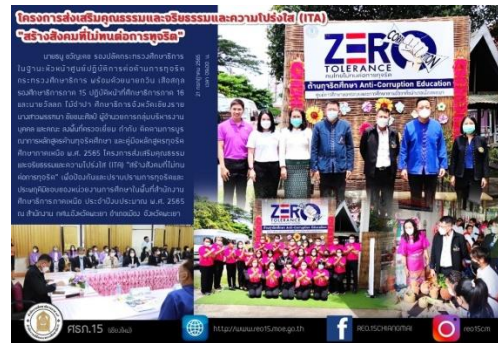
ภาพที่ ๑๗ แสดงการตรวจเยี่ยม กำกับ ติดตาม การนำหลักสูตรต้านทุจริตศึกษาไปบูรณาการในการจัดการเรียนการสอน กศน.อำเภอเมืองพะเยา จังหวัดพะเยา