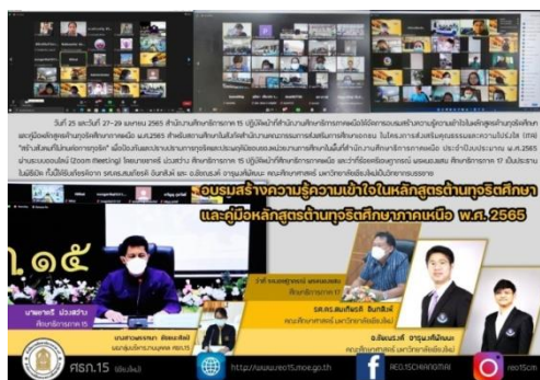
ภาพที่ ๘ แสดงการอบรมสร้างความรู้ความเข้าใจในหลักสูตรด้านทฤษฎีศึกษา และคู่มือหลักสูตรด้านทฤษฎีศึกษาภาคเหนือ พ.ศ. ๒๕๖๕ สำหรับสถานศึกษาในสังกัด สช.

๑.๑ เนื่องจากสถานการณ์การแพร่ระบาดของโรคติดเชื้อไวรัสโคโรนา ๒๐๑๙ จึงได้จัดอบรม สร้างความรู้ความเข้าใจในหลักสูตรด้านทฤษฎีศึกษา และคู่มือหลักสูตรด้านทฤษฎีศึกษาภาคเหนือ พ.ศ. ๒๕๖๕ สำหรับสถานศึกษาในสังกัดสำนักงานคณะกรรมการส่งเสริมการศึกษาเอกชน ให้แก่บุคลากรในสำนักงาน ศึกษาธิการภาค สำนักงานศึกษาธิการจังหวัด และสถานศึกษาในสังกัดสำนักงานคณะกรรมการส่งเสริมการศึกษา เอกชน ในพื้นที่สำนักงานศึกษาธิการภาคเหนือ ในวันที่ ๒๕, ๒๗ - ๒๙ เมษายน ๒๕๖๕ และจัดอบรมสร้างความรู้ ความเข้าใจในหลักสูตรด้านทฤษฎีศึกษา คู่มือหลักสูตรด้านทฤษฎีศึกษาภาคเหนือ พ.ศ. ๒๕๖๕ สำหรับสถานศึกษา ในสังกัดสำนักงานส่งเสริมการศึกษานอกระบบและการศึกษาตามอัธยาศัย ให้แก่บุคลากรในสำนักงานศึกษาธิการ ภาค สำนักงานส่งเสริมการศึกษานอกระบบและการศึกษาตามอัธยาศัยจังหวัด และสถานศึกษาในสังกัดในพื้นที่ สำนักงานศึกษาธิการภาคเหนือ ในระหว่างวันที่ ๒-๓ พฤษภาคม ๒๕๖๕ ผ่านระบบ Online (Zoom Meeting) มีผู้เข้ารับการอบรมจำนวน ๔,๙๐๖ คน และได้จัดส่งเกียรติบัตรอิเล็กทรอนิกส์ให้ผู้ผ่านการอบรมเรียบร้อยแล้ว