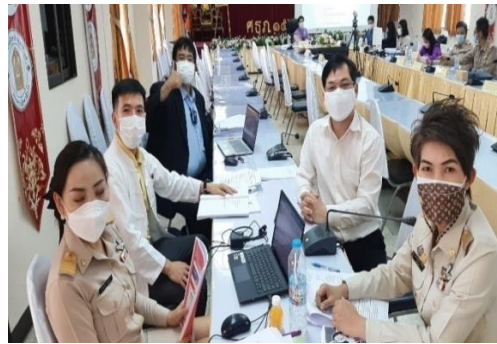
ภาพที่ ๔ แสดงการประชุมเชิงปฏิบัติการจัดทำ (ร่าง) คู่มือหลักสูตรด้านทฤษฎีศึกษาศาสนา พ.ศ. ๒๕๖๕ สำหรับสถานศึกษาในสังกัด กศน.