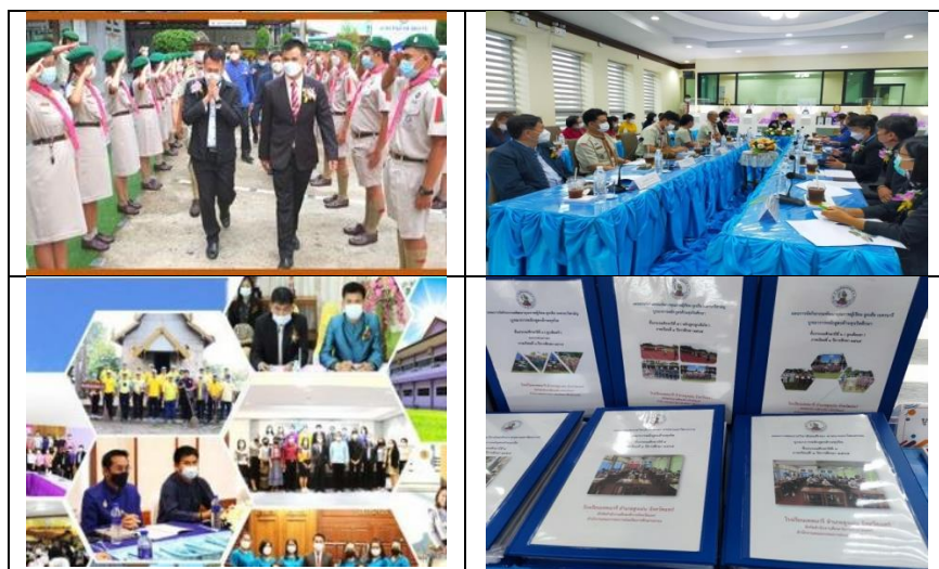
ภาพที่ ๑๘ แสดงการตรวจเยี่ยม กำกับ ติดตาม การนำหลักสูตรต้านทุจริตศึกษาไปบูรณาการในการจัดการเรียนการสอน โรงเรียนเทพนารี อำเภอสูงเม่น จังหวัดแพร่