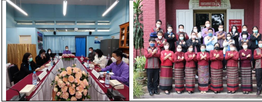
ภาพที่ ๑๙ แสดงการตรวจเยี่ยม กำกับ ติดตาม การนำหลักสูตรด้านทฤษฎีศึกษาไปบูรณาการในการจัดการเรียนการสอน โรงเรียนน่านคริสเตียนศึกษา อำเภอเมือง จังหวัดน่าน