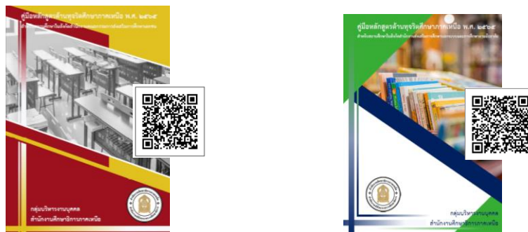
ภาพที่ ๗ แสดงคู่มือหลักสูตรด้านทฤษฎีศึกษาศึกษาภาคเหนือ พ.ศ. ๒๕๖๕

๒.๔.๑ จัดทำคู่มือหลักสูตรด้านทฤษฎีศึกษาศึกษาภาคเหนือ พ.ศ. ๒๕๖๕ สำหรับสถานศึกษา ในสังกัดสำนักงานคณะกรรมการส่งเสริมการศึกษาเอกชน จำนวน ๑๔๐ เล่ม สำหรับสถานศึกษาในสังกัด สำนักงาน ส่งเสริมการศึกษานอกระบบและการศึกษาตามอัธยาศัยจังหวัด จำนวน ๑๔๐ เล่ม