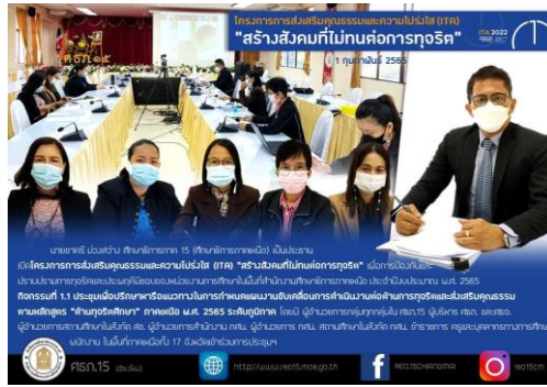
ภาพที่ ๑ แสดงการประชุมชี้แจง วางแผนและกำหนดทิศทางในการดำเนินโครงการ