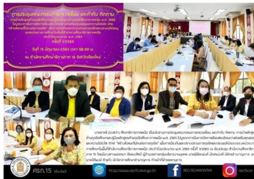
ภาพที่ ๑๐ แสดงการประชุมชี้แจงวัตถุประสงค์การตรวจเยี่ยม กำกับ ติดตาม และวางแผนการกำกับ ติดตาม การนำหลักสูตรด้านทฤษฎีศึกษาไปบูรณาการในการจัดการเรียนการสอน

๒. สำนักงานศึกษาธิการภาคเหนือ จัดส่งประกาศแต่งตั้งคณะกรรมการตรวจเยี่ยม กำกับ ติดตาม การนำหลักสูตรด้านทฤษฎีศึกษา และคู่มือหลักสูตรด้านทฤษฎีศึกษาภาคเหนือ พ.ศ. ๒๕๖๕ ไปบูรณาการ ในการจัดการเรียนการสอนโครงการส่งเสริมคุณธรรมและความโปร่งใส (ITA) “สร้างสังคมที่ไม่ทนต่อการทุจริต” เพื่อการป้องกันและปราบปรามการทุจริตและประพฤติมิชอบของหน่วยงานการศึกษาในพื้นที่สำนักงาน ศึกษาธิการภาคเหนือ ประจำปีงบประมาณ พ.ศ. ๒๕๖๕ แบบกำกับ ติดตาม การนำหลักสูตรไปบูรณาการในการ จัดการเรียนการสอน และแบบเก็บข้อมูลตัวชี้วัดที่ ๑ – ๓ ไปยังสำนักงานศึกษาธิการภาค ๑๕ - ๑๘ และขอให้แจ้ง สำนักงานศึกษาธิการจังหวัด สำนักงานส่งเสริมการศึกษานอกระบบและการศึกษาตามอัธยาศัยจังหวัดในพื้นที่ ทราบ และมอบหมายให้สำนักงานศึกษาธิการจังหวัดทำหน้าที่ประสานงานกับคณะกรรมการกำกับ ติดตาม ระดับ จังหวัด ทั้งนี้ ขอให้คณะกรรมการระดับภาค คณะกรรมการระดับจังหวัด และหน่วยงานกำกับ ติดตามในพื้นที่ ดำเนินการตรวจเยี่ยม กำกับ ติดตาม ระหว่างวันที่ ๑๖ – ๓๐ มิถุนายน ๒๕๖๕ โดยใช้แบบฟอร์มกำกับ ติดตาม พร้อมทั้งสรุปและจัดส่งหน่วยงานที่เกี่ยวข้องภายในระยะเวลาที่กำหนด