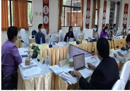
ภาพที่ ๓ แสดงการประชุมเชิงปฏิบัติการจัดทำ (ร่าง) คู่มือหลักสูตรด้านทฤษฎีศึกษาศาสนา พ.ศ. ๒๕๖๕ สำหรับสถานศึกษาในสังกัด สช.